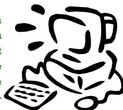
Légende accompagnant l'illustration.

En espérant que tous ces changements de person-